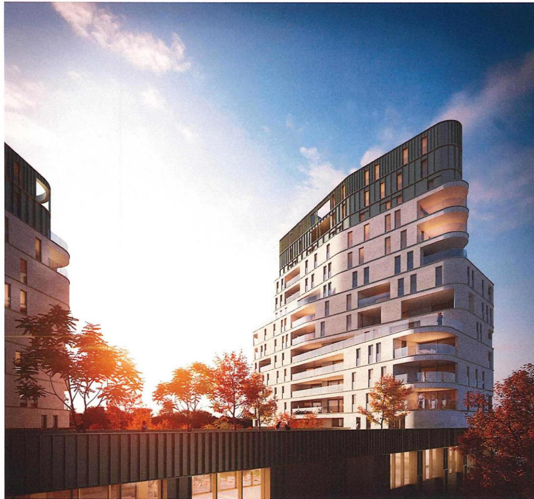
REDROSE ANDENNE | VISUALISATION